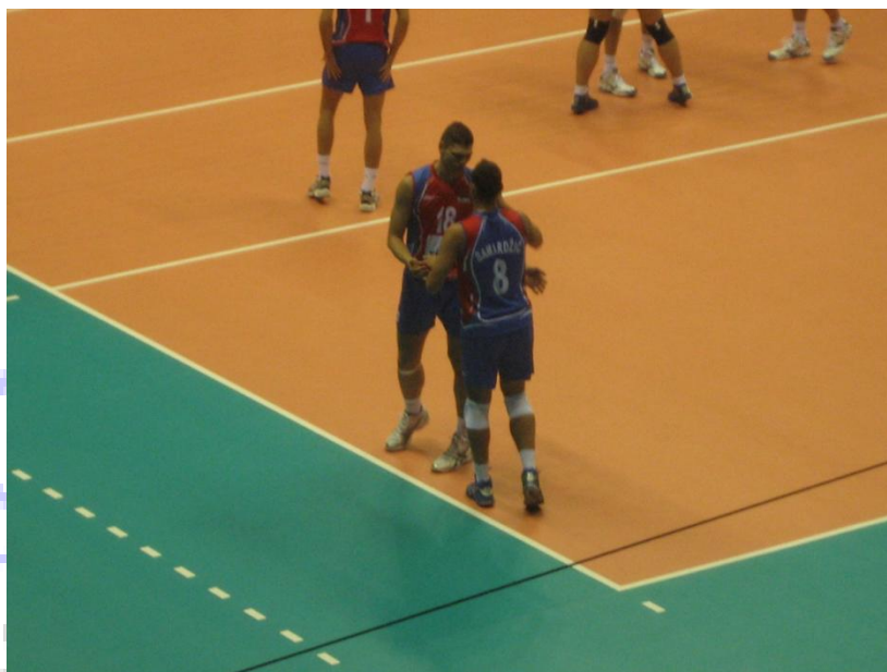
Reprezentanca Srbije na Svetovnem prvenstvu v Italiji (slabo viden dres libera s št. 8)