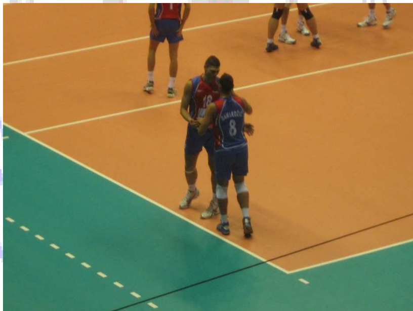
Reprezentanca Srbije na Svetovnem prvenstvu v Italiji (slabo viden dres libera s št. 8)