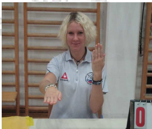
Libero »v« igri oz. libero »iz« igre